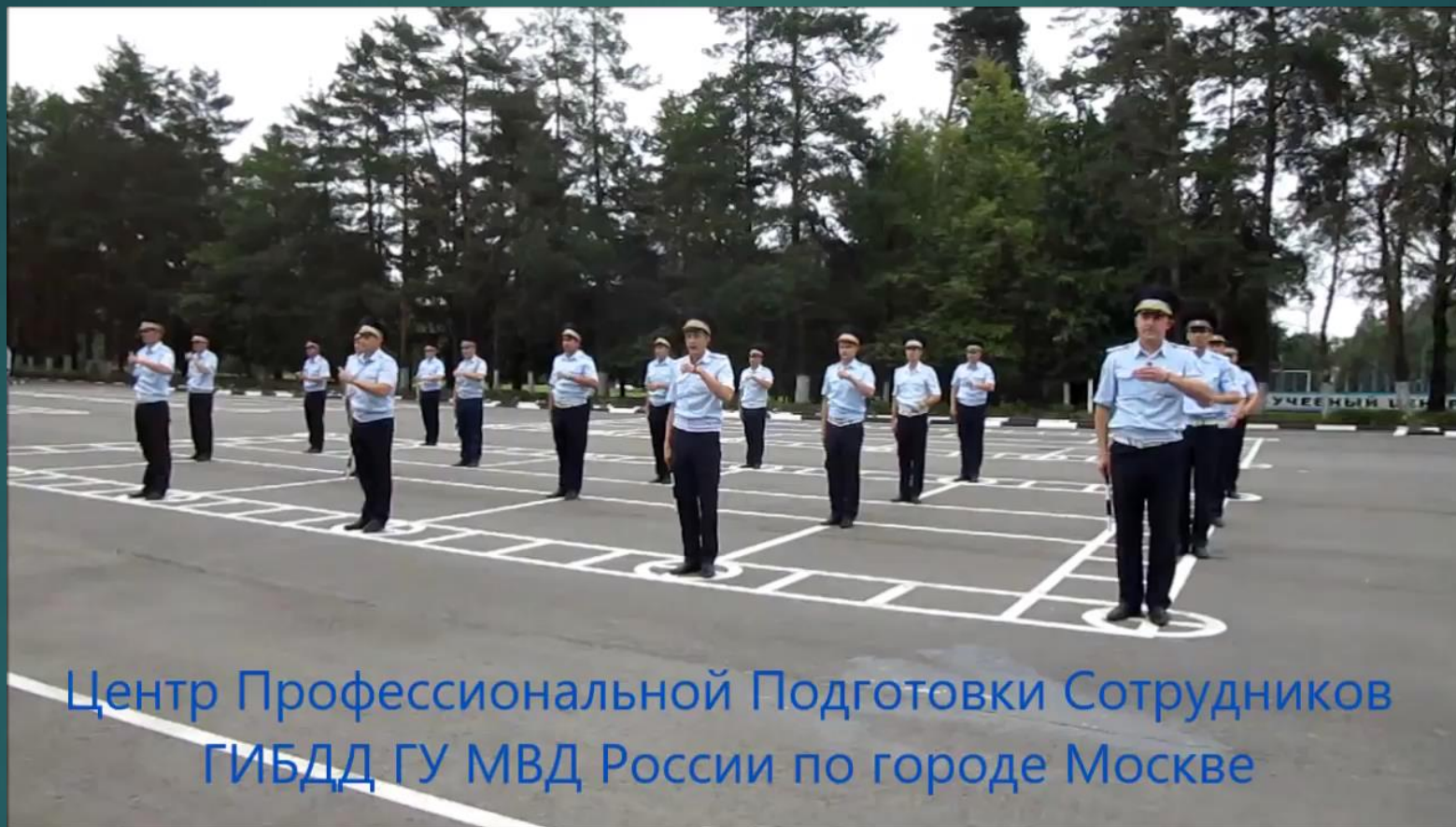
Центр Профессиональной Подготовки Сотрудников ГИБДД ГУ МВД России по городе Москве